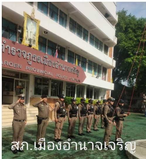
สภ.เมืองอำนาจเจริญ