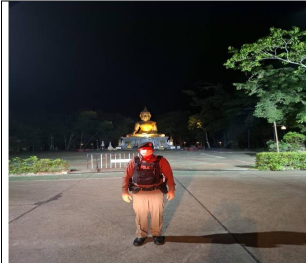
(ภาพประกอบ พอสังเขป)