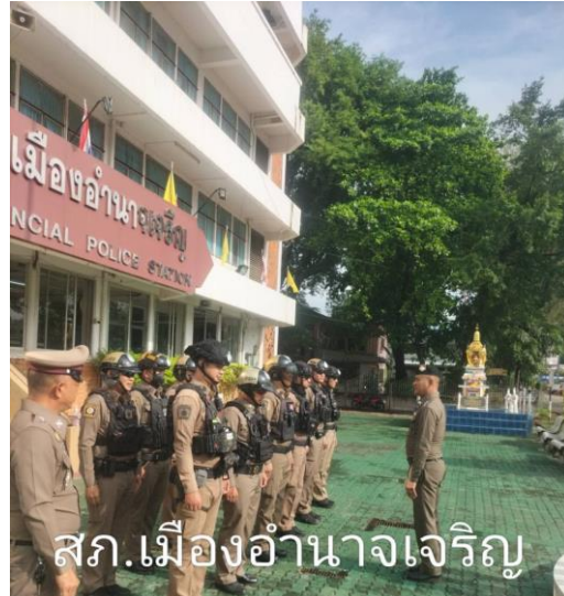
สภ.เมืองอำนาจเจริญ