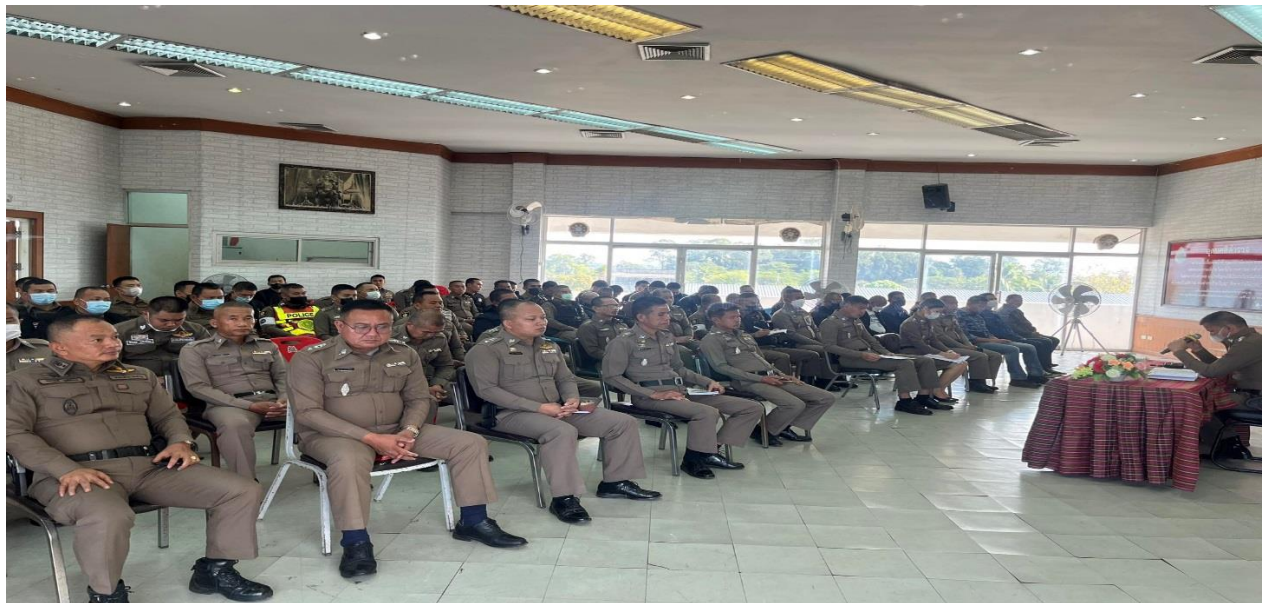
สถานีตำรวจภูธรเมืองอำนาจเจริญ