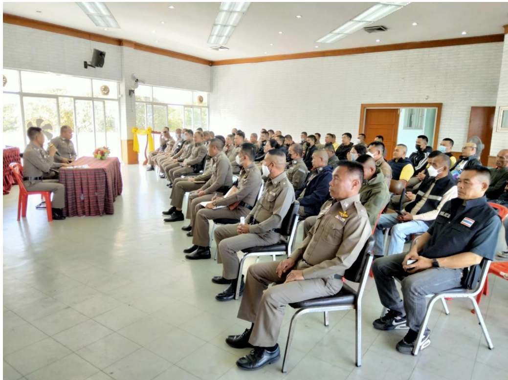
สถานีตำรวจภูธรเมืองอำนาจเจริญ